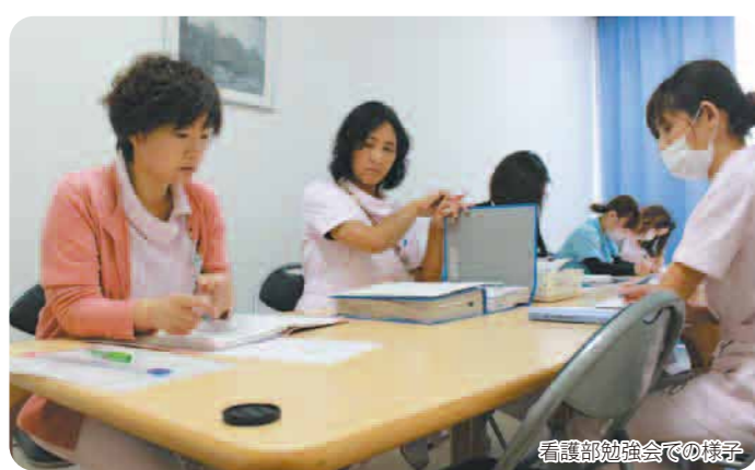
看護部勉強会での様子

【A】入院される患者様は高齢の方や、持病を抱えていたり認知症などで退院後の日常生活へ大きな不安を抱えている方も多くいらっしゃいます。私たち看護師は、あらゆる健康レベルにある患者様の立場に立つて、医師・薬剤師・リハビリスタッフ・栄養士の他、福祉サービス等とも連携を深め、患者様やそのご家族が安心して退院できるような看護を提供していきます。