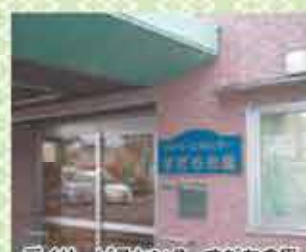
デイサービスセンターすだちの里

○グループホームすだちの里 平成16年開所。若林沖野地区にて13年、認知症の方が24時間365日可能な限り自立した生活が送れるよう中嶋病院在宅部門と連携してサービスを提供しております。 ○デイサービスセンターすだちの里 グループホームと併設している、定員33名の施設です。リハビリやお風呂だけではなく、やりたいことの実現に向けた取り組みも行ってあります。 ■住所/仙台市若林区沖野7丁目6-30 ☎022-379-7442 [運営本部] ☎022-781-2382 [グループホームすだちの里] ☎022-781-2385 [デイサービスセンターすだちの里]