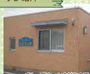
グループホームすだちの里